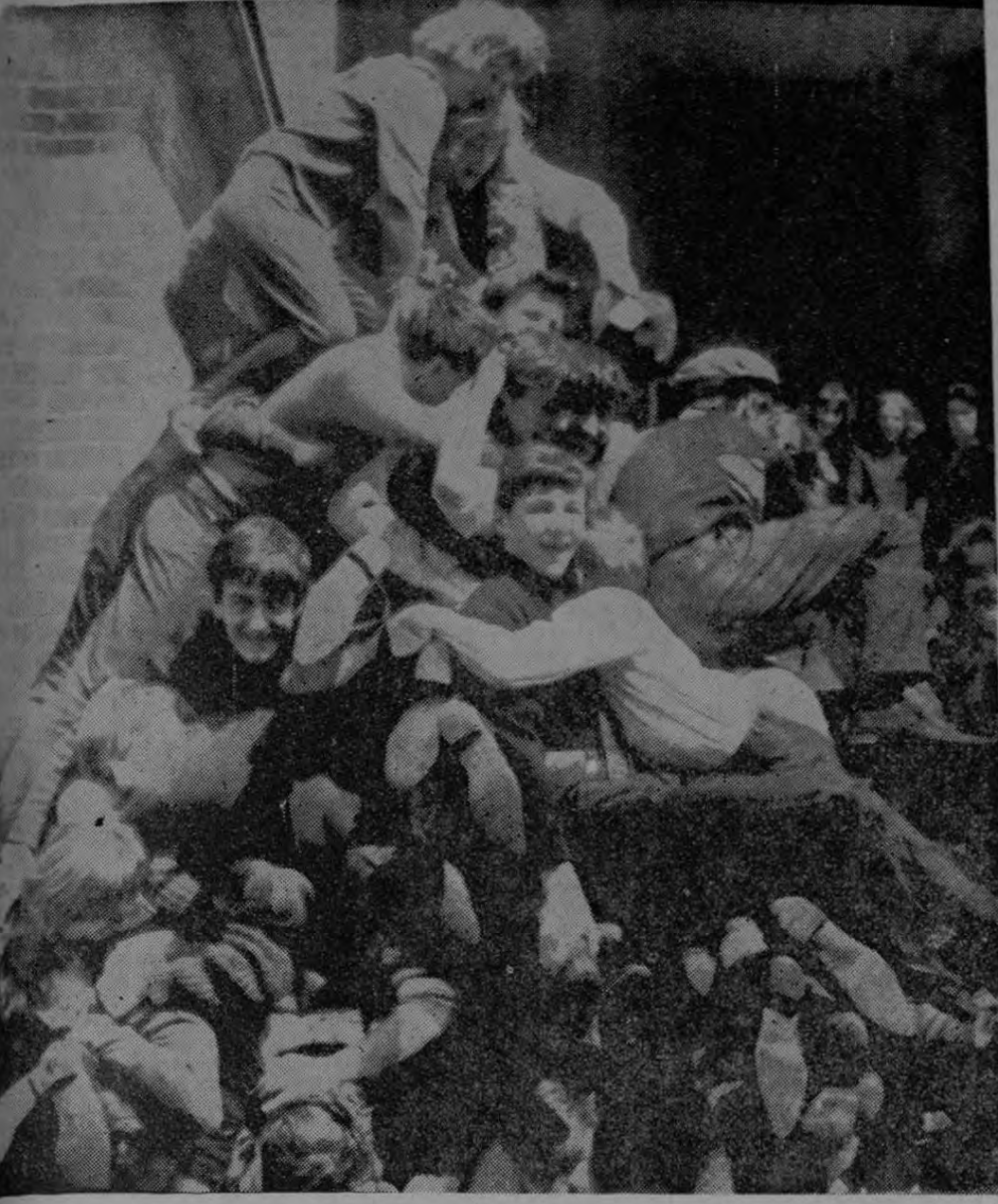
YORKSHIRE, INGLATERRA, 16 (AP). Los estudiantes del Wakefield Technical and Arts College aquí, trataban de romper el record mundial de 42 estudiantes en una cama —ayer lo intentaron. Aquí se les ve, unos sobre otros. El Decano dijo que rompieron el record cuando unos 50 estudiantes se echa-

Los funcionarios gubernamentales del Departamento del Trabajo dijeron que la mayoría de los trabajadores en las Pasa a la Pág. TRES