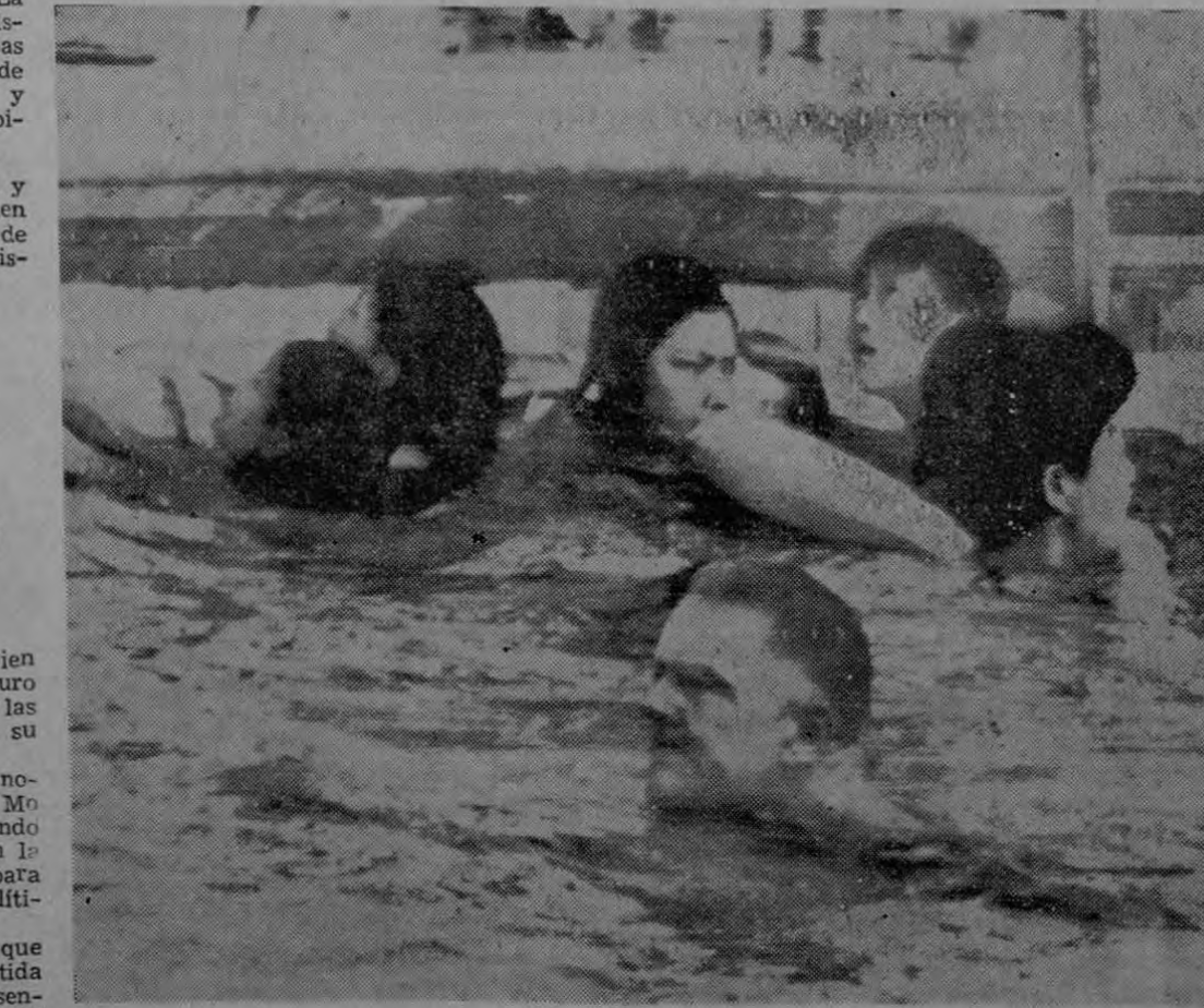
SAIGON, 16 (AP). El embajador Henry Cabot Lodge considerado en la encuesta política como el principal hombre en la elección primaria presidencial republicana hoy, toma

Panamericana, Mora más bien parecía mirar hacia el futuro de la Organización que a las especulaciones en torno a su futuro. En una conversación sin notas con este Corresponsal, Mora dijo que está trabajando con sus asesores íntimos en la formulación de un plan para vigorizar el mecanismo político de la OEA. Dijo que el documento que serviría de punto de partida en tal proyecto sería presentado posiblemente en un mes al Consejo y a los Estados americanos para su consideración. Mora considera que en su as Pasa a la Pág. TRES